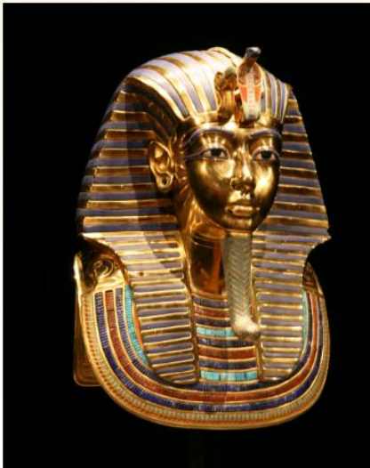
Tutanchamon – maska

... ve starším období byli faraonové pohřbíváni ve zvláštních hrobkách – pyramidách, později ve hrobkách vytesaných ve skále?