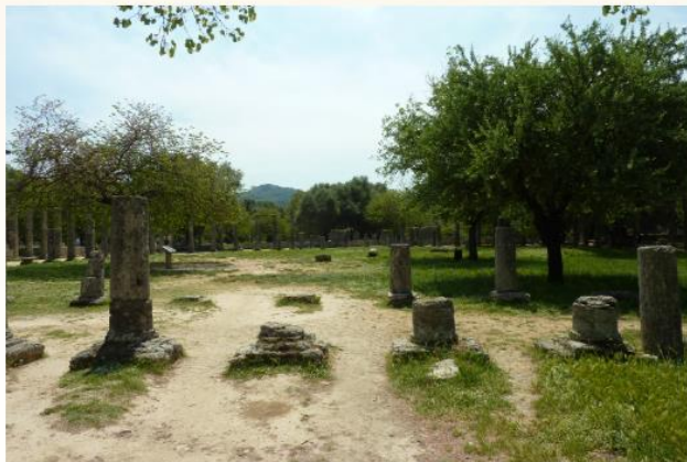
Archea Olympia – Palaistra