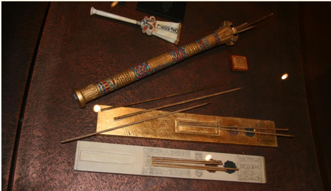
písařské náčiní ve starověkém Egyptě

... že písmo je jedním ze základních předpokladů vzniku vzdělanosti a civilizace?