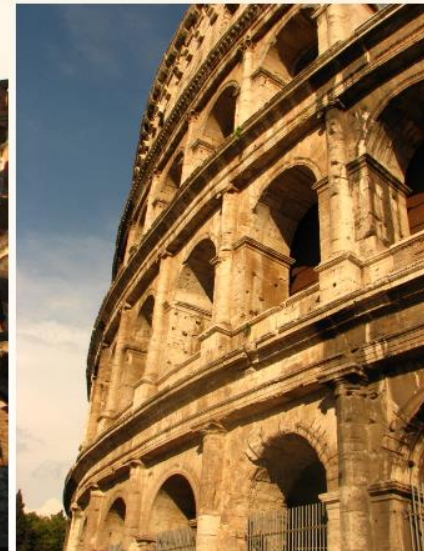
starověké památky v Římě