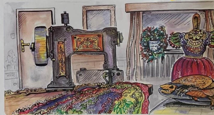
pokoj, stroj, kraj, talíř, uzenáč, květináč, krajíc