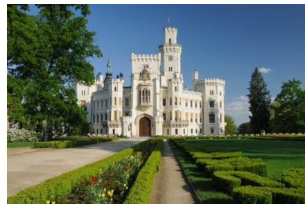
Hluboká nad Vltavou